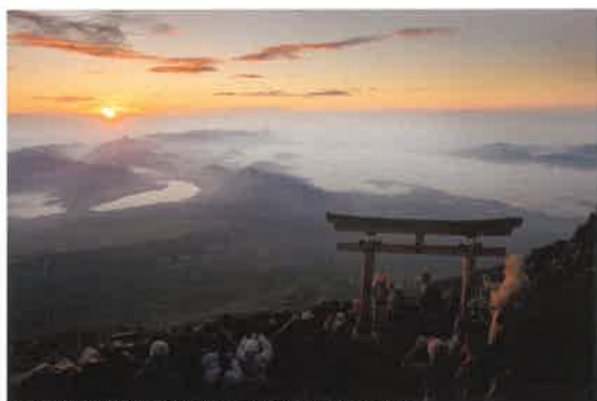
富士山頂から御来光を見る登山者 2013年