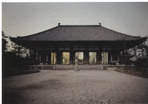
唐招提寺金堂 1968年頃