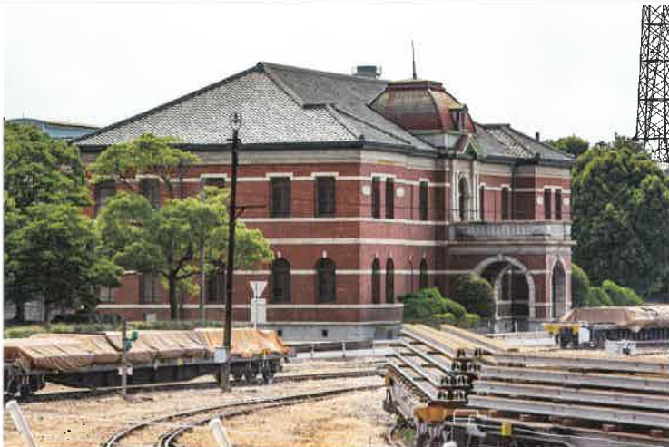
官営八幡製鐵所 2015年

しかし八幡にいれば何とか暮らせるのだ。八幡製鐵所があった、その下にまた別の下請け会社の働き口があって、町がある。八幡の活気を頼って西日本一帯から続々と人が集まる。 村田善代子「八幡炎災記」(平凡社、二〇一五年二月)より