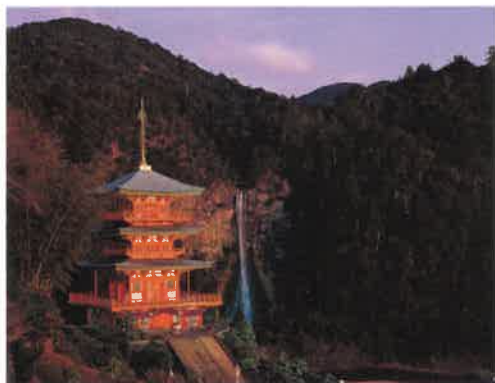
青岸渡寺三重塔と那留大滝 1994年

本展を通して、「日本の世界文化遺産」を未来へと継承する意義を見出していただければ幸いです。