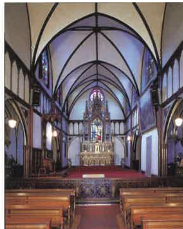
大浦天主堂内部 1989年