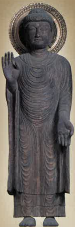
釈迦如来立像(清涼寺式)(重文)／宮城県・龍宝寺

西大寺を復興した叡尊は、清涼寺の釈迦如来像を深く信仰し、その姿を写した像を本尊としました。またその弟子忍性は文殊菩薩を心から敬愛しました。世の窮民の救済に邁進した叡尊と忍性ゆかりの仏像と肖像を通じ、弱き者に寄り添う精神を伝えます。