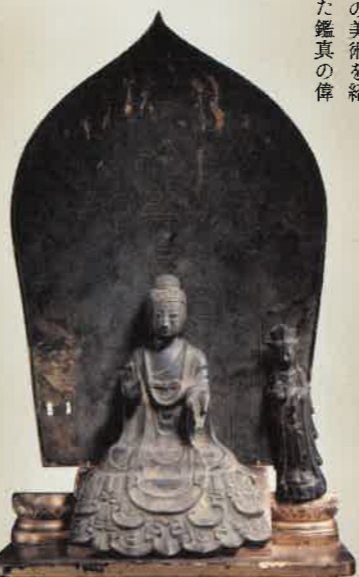
釈迦如来及び脇侍像(重文) 奈良県・法隆寺