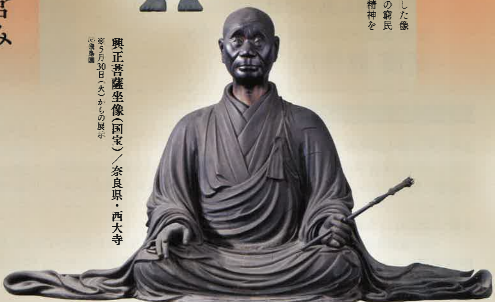
興正菩薩坐像(国宝)／奈良県・西大寺 ※5月30日(火)からの展示