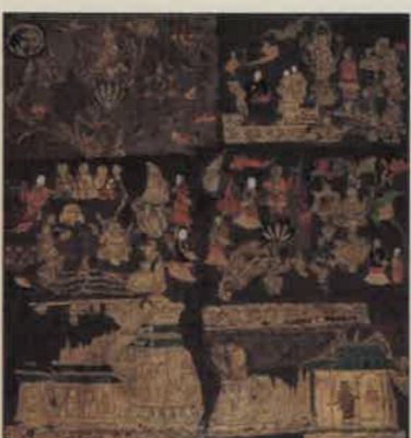
天寿国繡帳(国宝)／奈良県・中宮寺 ※5月23日(火)からの展示

故人を悼む気持ちから造られた仏像を通して、古代の人々の精神に触れます。七四三年に災厄から日本を護るために造られた東大寺大仏の思想と美術、また、平家の焼き討ちによって焼失した南都の主要寺院の復興を成し遂げた僧・重源の思想が生み出した美術を紹介します。