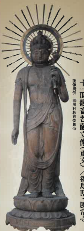
十一面観音菩薩立像(重文)／福島県・勝常寺

薬師如来と観音菩薩は古代に東北地方で多く造られました。苦難に立ち向かう古代の人々がこれらの仏像へ寄せた期待を振り返ります。また、古代に人々の信仰を集めた仏教世界の神・天たちの活躍を紹介します。