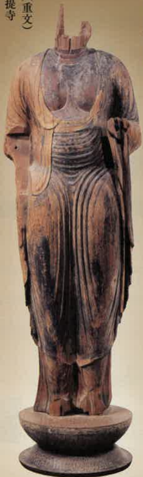
如来形立像(重文) 奈良県・唐招提寺

唐招提寺の如来形立像は「唐招提寺のトルソー」として、明治以来人々の思いを集めてきました。困難な状況にありながら生き抜いてきた仏像の姿を通じ、未来へとつながる人間の営みを見つめます。