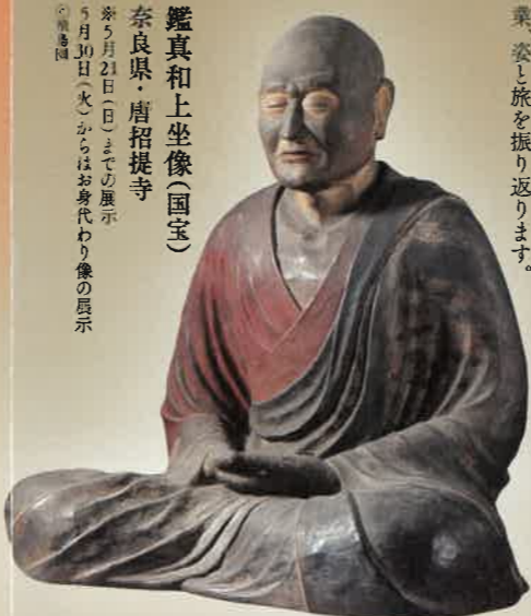
鑑真和上坐像(国宝) 奈良県・唐招提寺 ※5月21日(日)までの展示 ※5月30日(火)からはお身代わり像の展示 ◎飛鳥園

奈良時代以降、時を経て繰り返される聖徳太子への思いやその美術を紹介します。また、幾多の困難を乗り越えて来朝し、仏教を伝えた鑑真的偉業、姿し旅を振り返ります。