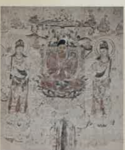
法隆寺金堂壁画(模写) 第6号壁阿弥陀浄土図 秋田県・大仙市 鈴木空如筆 昭和十一(一九三〇)年 ※5月14日(日)までの展示 5月16日(火)からは第10号壁薬師浄土図(展示替え)