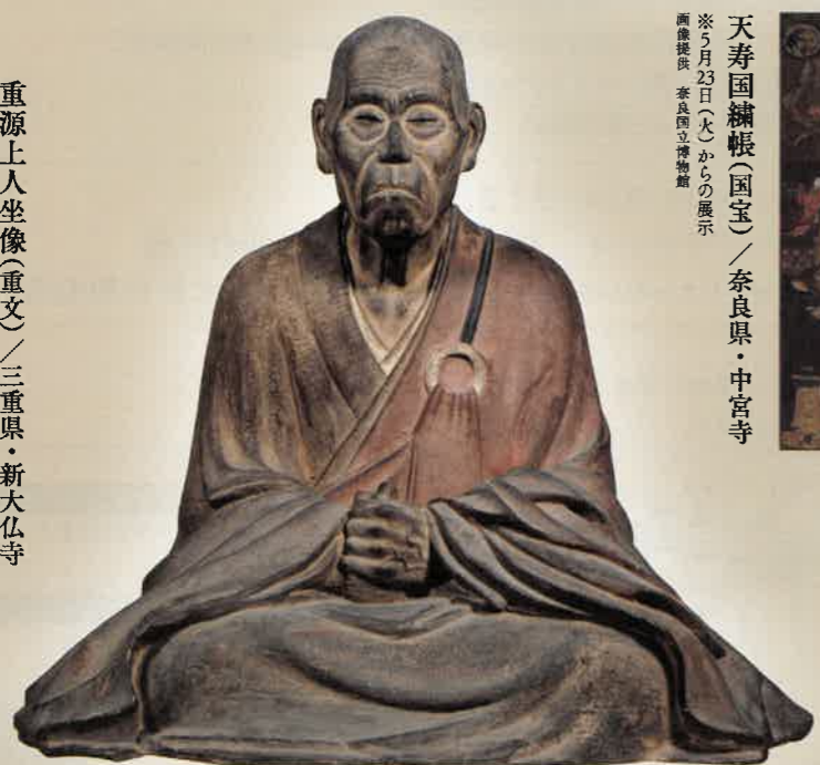
重源上人坐像(重文)／三重県・新大仏寺