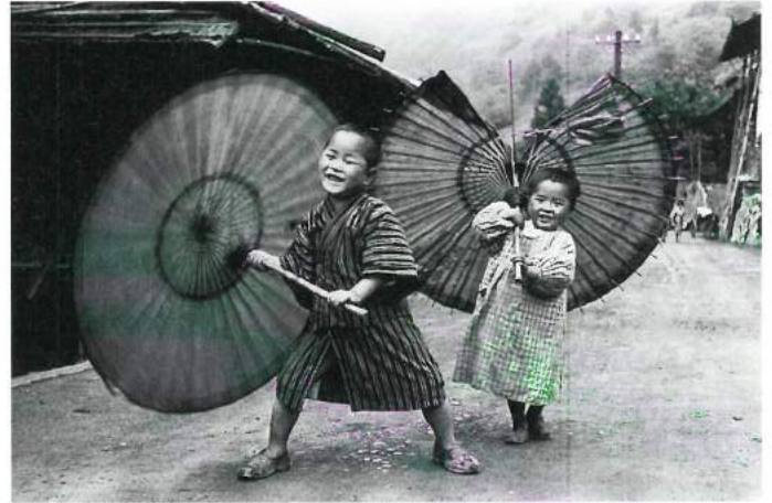
「傘を回すこども」 東京・小河内村 昭和12年(1937)頃 土門拳