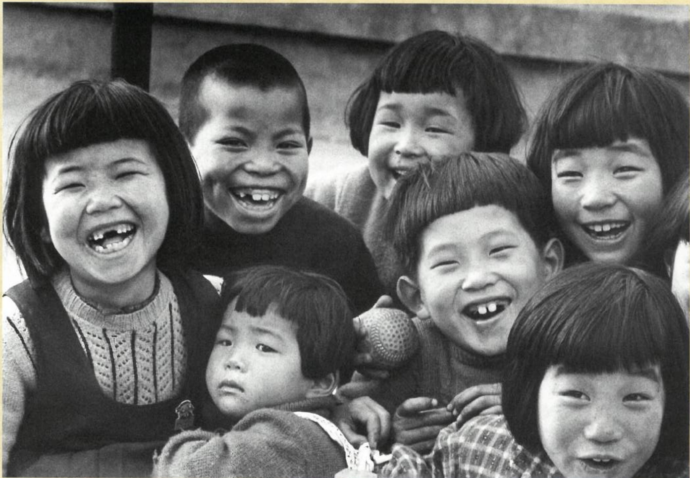
笑う子 東京・江東 昭和28年(1953) 土門拳