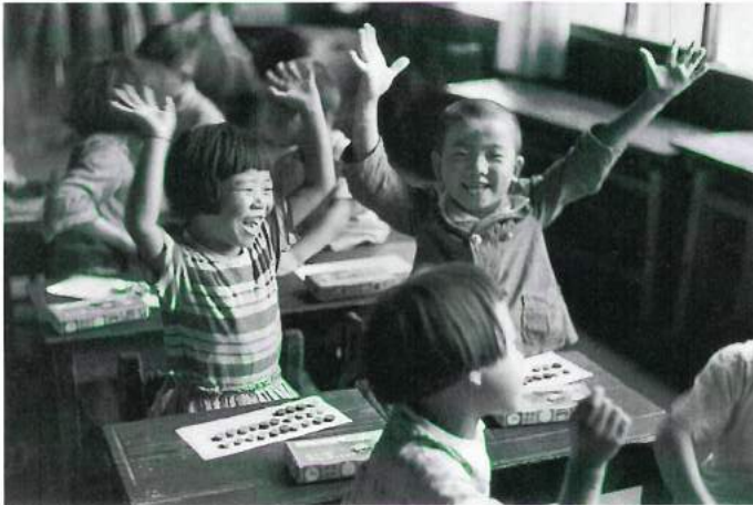
「数あそび」 長野県・会地村 昭和28年(1953) 熊谷元一

本展は、日本写真史に足跡を残す19名の写真家が捉えたこどもの姿を通して、昭和の歩みを辿る構成としており、平成世代には昭和の風俗に対しより一層理解を深め、また、昭和世代には自らの幼き日の思い出を呼び起こす機会となるでしょう。