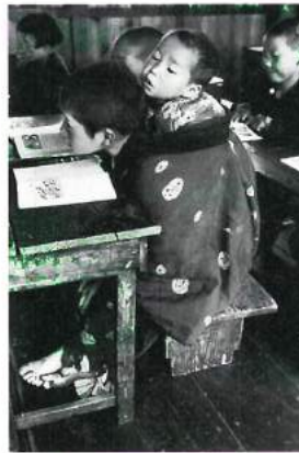
「分教場」 岩手県久慈市山根 昭和33年(1958) 林忠彦