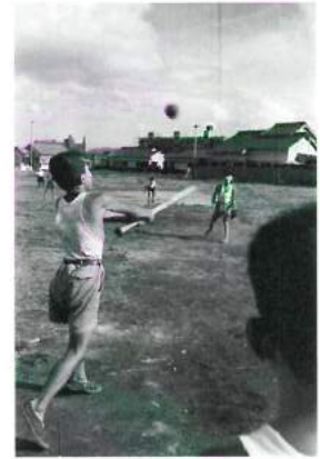
「三角ベース」 福岡県・春日町春日原 昭和31年(1956) 井上孝治