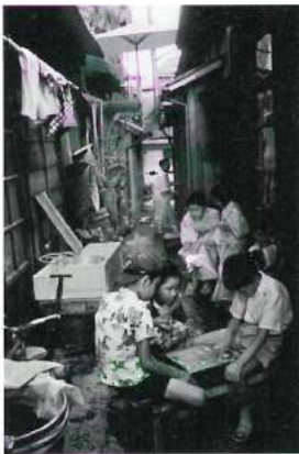
「路地裏で縁台将棋」 東京・佃島 昭和33年(1958) 田沼武能