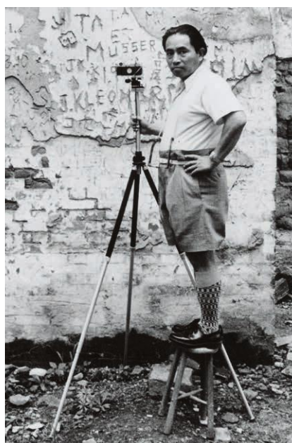
ヒロシマ撮影中の土門拳 1957年